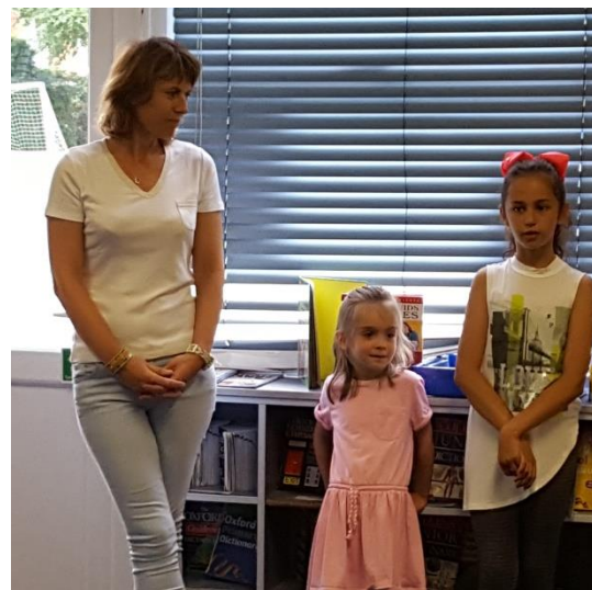
Envoyées spéciales au salon du livre jeunesse

J'ai bien aimé le spectacle car tout le monde a fait de son mieux. J'ai bien aimé être journaliste.