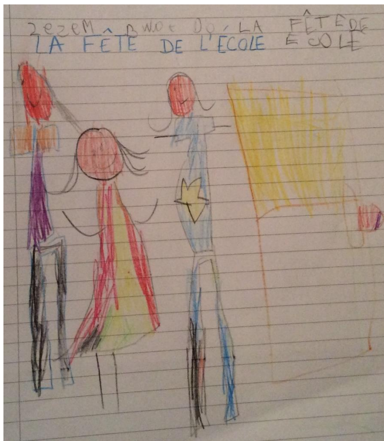
Fête de l'école, par Anne

J'aime bien regarder les vidéos des danses marocaines des mariages de mes tantes.