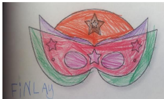
En haut, masque de super-héros par Finlay